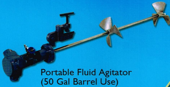
Portable Fluid Agitator (50 Gal Barrel Use)