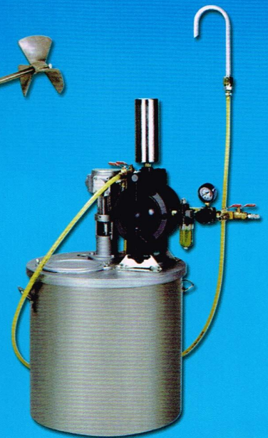
Ink Circulating & Feeding Pump

GAU JING INDUSTRIAL CO., LTD. 高 璟 實 業 有 限 公 司 No.46, Industrial 23rd Rd., Taichung, Taiwan 408 TEL:886-4-23502188. 23501908 FAX:886-4-23502398 E-Mail:gaujing@gmail.com http://www.yog.com.tw